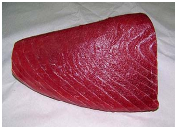
TONNO NON TRATTATO

QUESTA PERO' SIE' RIVELATA ESSERE UNA BRUTTA ABITUDINE.